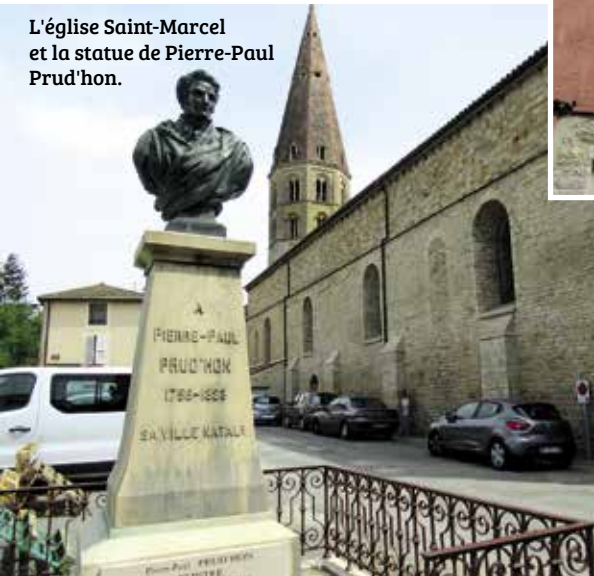
L'église Saint-Marcel et la statue de Pierre-Paul Prud'hon.