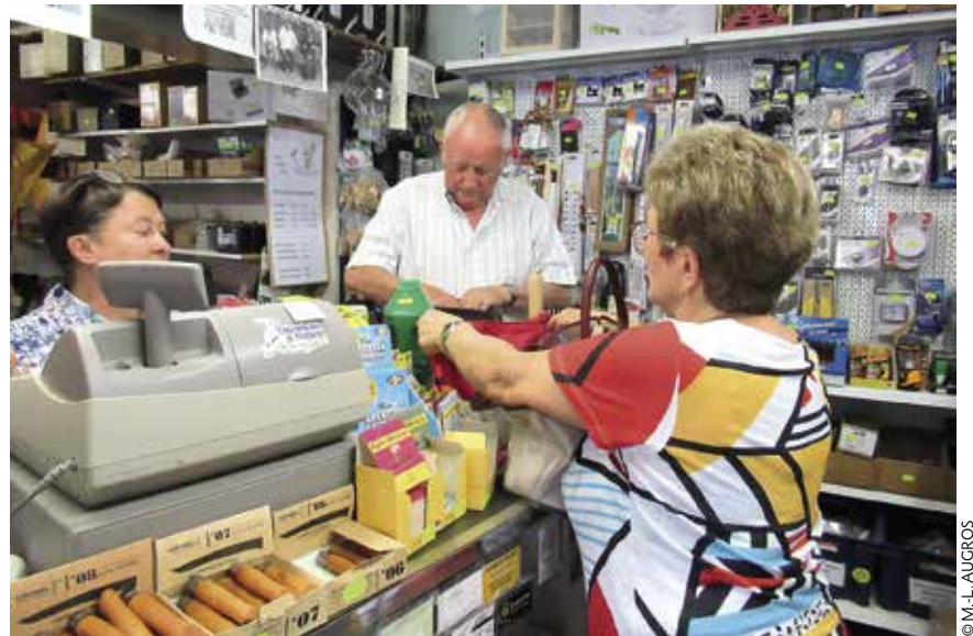
Magasin de Agri-Mauguin.