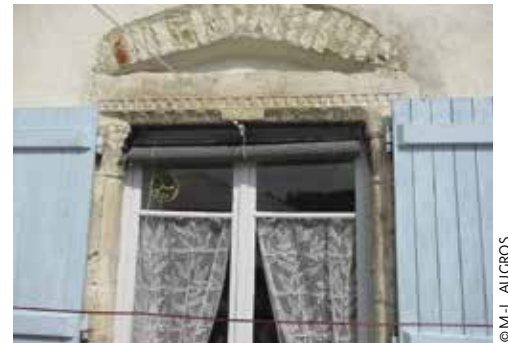
Fenêtre sculptée provenant de l'ancien portail de Saint-Marcel.