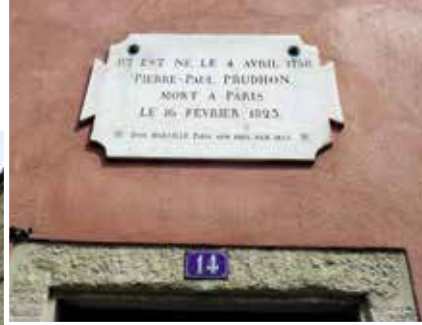
Maison de Pierre-Paul Prud'hon.