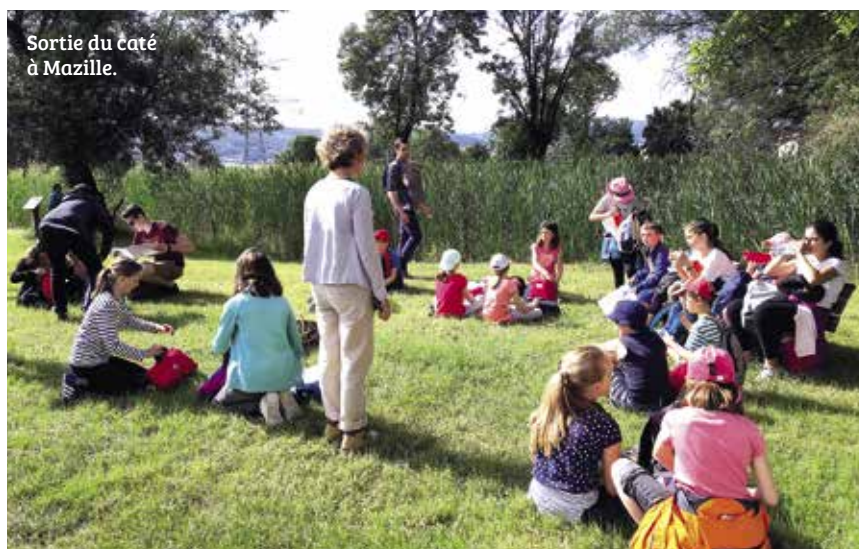
Sortie du caté à Mazille.

Voici quelques exemples de temps forts de l'année: la préparation du sacrement de réconciliation, la retraite et la messe de première communion préparée avec les parents, la randonnée au Carmel de Mazille et la rencontre