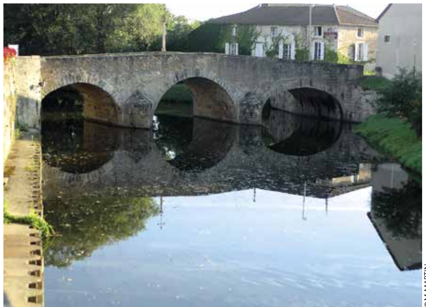
Le pont de la Levée.

Dans la petite rue des Tanneries, il existait onze tanneries jusqu'au XIX e siècle, qui travaillaient les peaux provenant des abattoirs, dans l'eau du bief des trois rivières réunies. En face