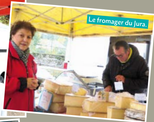
Le fromager du Jura.