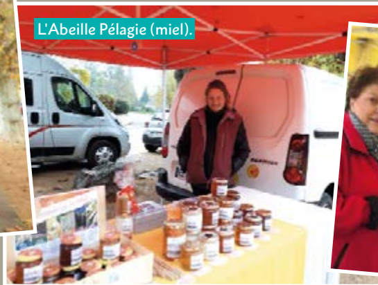
L'Abeille Pélagie (miel).