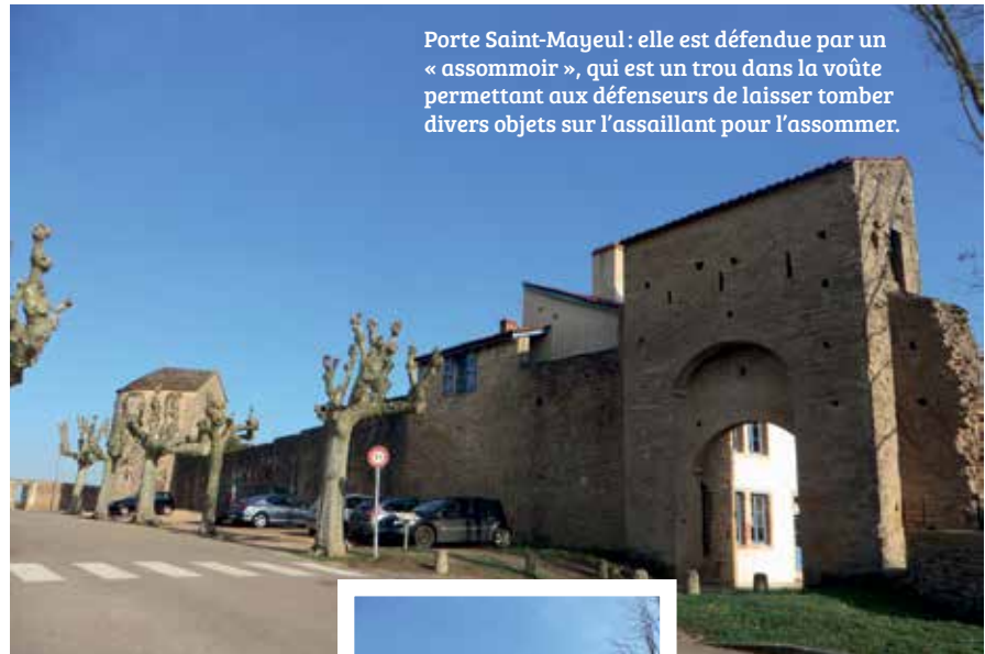
Porte Saint-Mayeul : elle est défendue par un « assommoir », qui est un trou dans la voûte permettant aux défenseurs de laisser tomber divers objets sur l'assaillant pour l'assommer.

Sur une colline de 400 m dominant le bourg de Cluny se trouve le prieuré Saint-Mayeul, près de la porte du même nom. L'église Saint-Mayeul, que l'on voit encore sur des gravures de Lallemand de 1784, n'existe plus. Le seul élément qui reste encore de cette église est le mur sud, daté