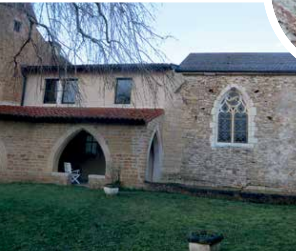
Le prieuré et la chapelle Jean Germain