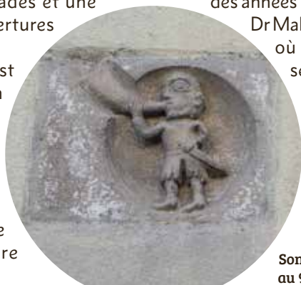
Sonneur de l'olifant au 9, rue Saint-Mayeul.

Au XVIII e la maison est « modernisée ». Plus rien de médiéval n'apparaissait. Les éléments de décor du XII e ont été réemployés sur place. Une vaste cage d'escalier a été créée avec une rampe forgée de frère Placide.