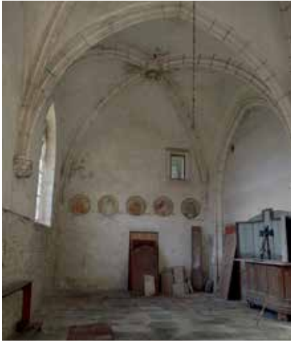
Chapelle Jean Germain.